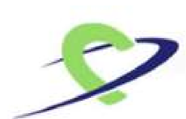
DGSP Sportärztebund Baden e.V.